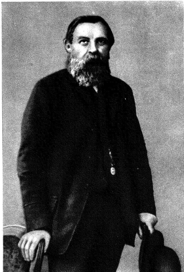
Friedrich Engels (1888)