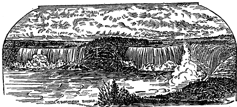
Spencer House, Niagara Falls, N. Y.